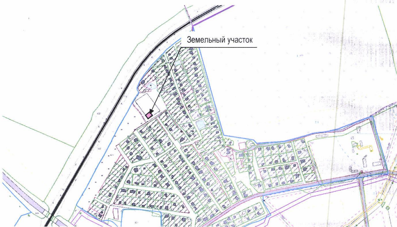
Ситуационная схема размещения участка

Земельный участок сформирован для проведения аукциона на право заключения договора аренды для строительства и обслуживания торгового объекта в д.Волковичи, Фанипольского с/с, Дзержинского района. Площадь участка составляет ориентировочно – 0,0500 га. Подъезд к участку будет осуществляться по существующей дорожной сети. Граница земельного участка фиксированная.