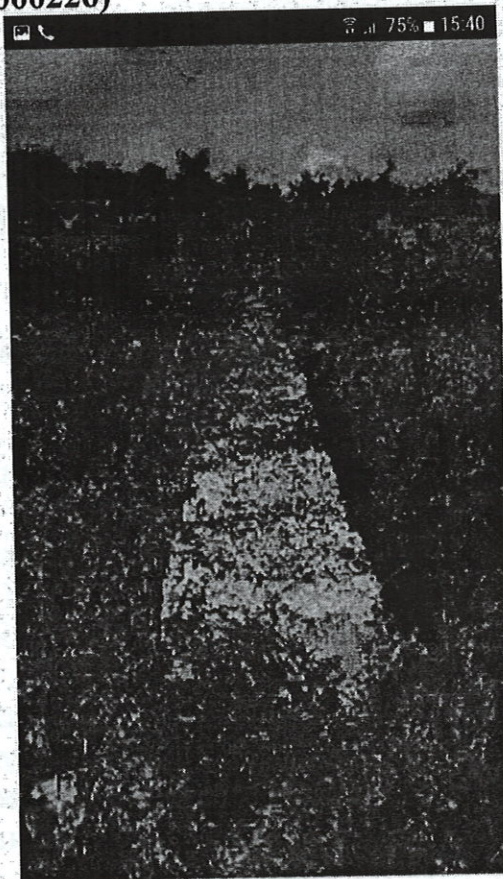
Фотография (скриншот) 2