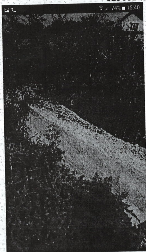
Фотография (скриншот) 1

Минский р-н, Ждановичский с/с, д. Дегтяревка (кадастровый номером 623681702101000226)